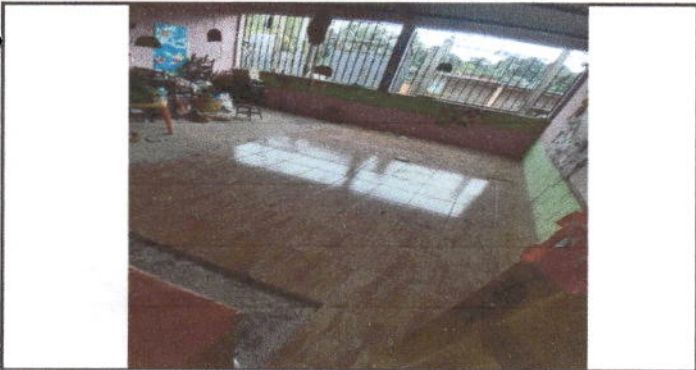
Foto 5: Se observa el piso que sera sustituido por piso cerámico en aulas.