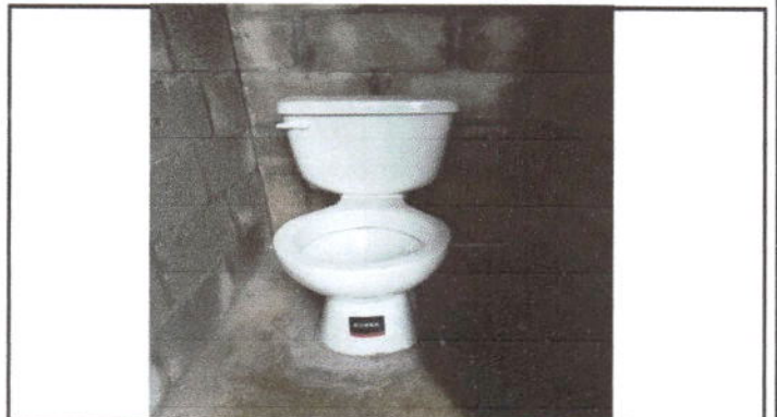
Foto 4: Sustrucción de sanitarios y sus accesorios modulo 1 de baños.