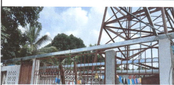
Foto 1: Sustrucción de lámina, por lámina troquelada aluzinc calibre 26 en cocina.